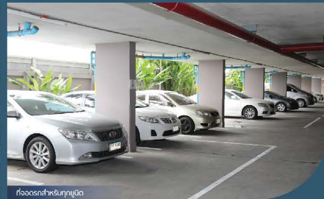
ที่จอดรถสำหรับทุกยูนิต