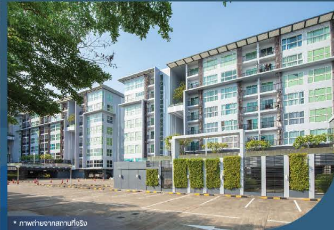
* ภาพถ่ายจากสถานที่จริง