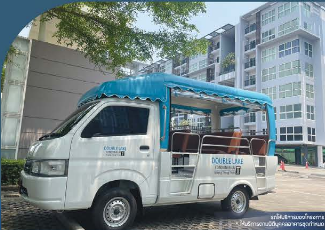
รถให้บริการของโครงการ * ให้บริการตามวัน/เวลาที่อาคารสูงกำหนด