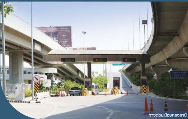
ทางด่วนเมืองทองธานี