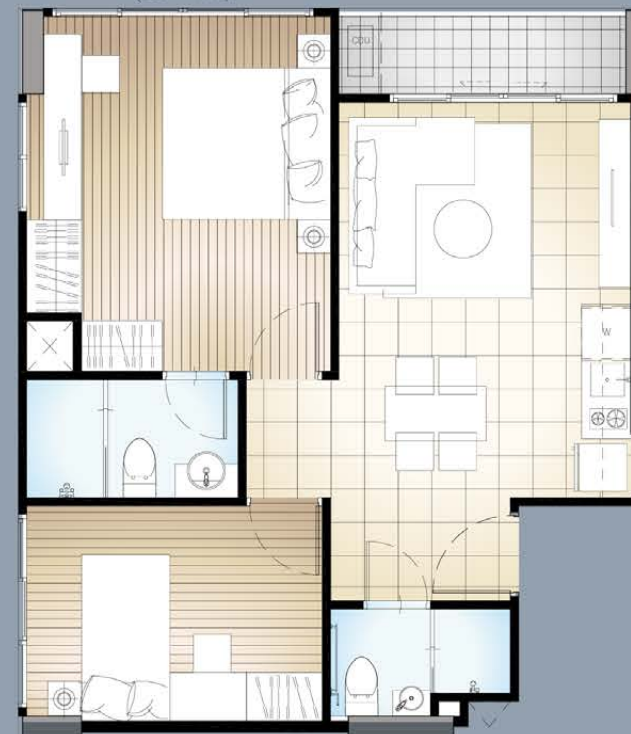
2 BEDROOM TYPE 3 56.07 Sq.m.