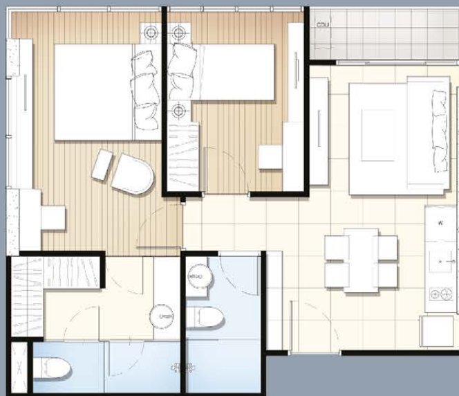
2 BEDROOM TYPE 2 56.58 - 56.83 Sq.m.