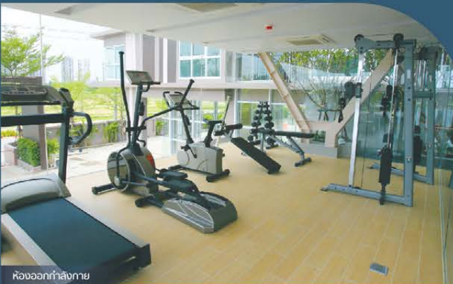
ห้องออกกำลังกาย