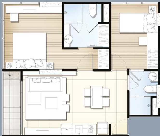
2 BEDROOM TYPE 1 56.69 - 57.10 Sq.m.