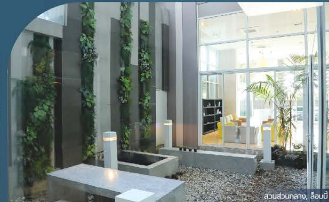
ส่วนส่วนกลาง, ล็อบบี้