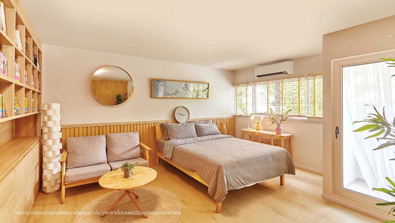
*ภาพถ่ายจากห้องตัวอย่างใช้เพื่อการโฆษณาเท่านั้น ราคาขายไม่รวมเฟอร์นิเจอร์และอุปกรณ์ตกแต่ง