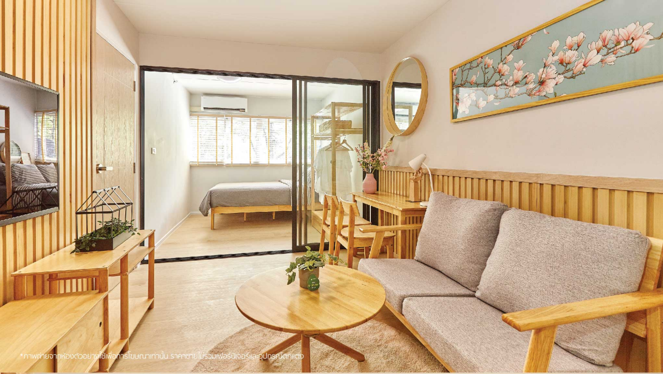
*ภาพถ่ายจากห้องตัวอย่างใช้เพื่อการโฆษณาเท่านั้น ราคาขายไม่รวมเฟอร์นิเจอร์และอุปกรณ์ตกแต่ง