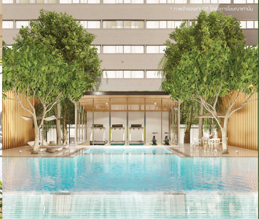
* ภาพจำลองสถานที่ ใช้เพื่อการโฆษณาเท่านั้น